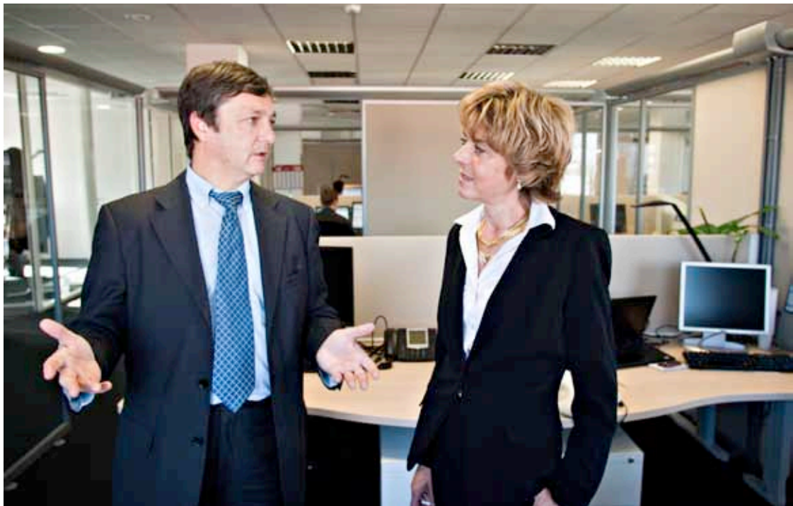
Dialogue dans les bureaux de Monext, à la Duranne

Recruter les bons candidats, former les salariés, les accompagner... Ces missions RH, universelles, se construisent autour de la culture de chaque entreprise et des obligations imposées par le législateur. Elles s'inscrivent aussi, fatalement, dans des territoires aux profils uniques. Pour parler de leurs politiques RH et savoir si l'environnement peut les influencer, nous avons fait débattre Monext et Dassault Systems, deux entreprises d'Aix-en-Provence.