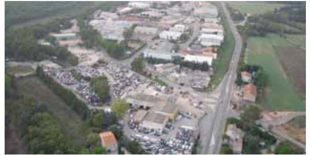
« Près de l'ex nationale 7, le plateau d'Activités de la Pile est le poumon économique de Saint-Cannat »

2011 sera donc une année chargée en projets. Nous espérons qu'ils accompagneront favorablement la croissance des entreprises du Plateau de La Pile et qu'ils contribueront à leur rayonnement à l'extérieur de la commune.