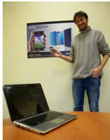
Avec WYSIPS, l'écran solaire de nos portables est pour demain

Pour tous ces projets, l'entreprise, créée en 2008, a levé 1,8 M d'€ auprès d'investisseurs et de fonds publics. Les films photovoltaïques et la centrale, destinée aux pays à fort ensoleillement, seront commercialisés en fin d'année. La sortie du 1 er portable solaire est prévue en 2012. Membre de Capenergies, la société a prévu de recruter 20 personnes d'ici juin 2012 et doit se relocaliser cette année sur un pôle d'activités du Pays d'Aix.