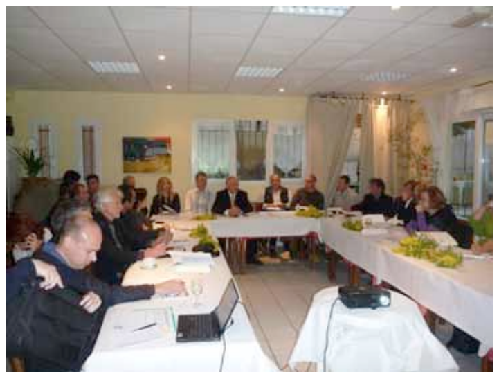
Les Lundis d'Azalée », des rencontres pros et conviviales

Un dernier mot : le Très Haut Débit est arrivé. Il est possible de mutualiser le raccordement aux entreprises, assez onéreux. Pour l'heure, Azalée recense les besoins.