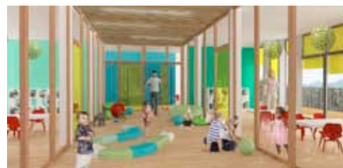
Des bambins pris en charge, ... des parents rassurés

En cas de succès confirmé, d'autres projets de crèches seront étudiés. Cet accueil des tout-petits souligne aussi le succès du concept de La