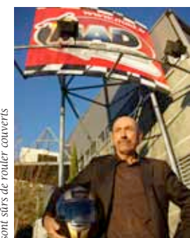
Avec MAD et les casques Torx, les motards sont surs de rouler couverts

L'entreprise Mad, située à Châteauneuf-le-Rouge est un des trois leaders français de la distribution de casques de motos. Elle opère aussi activement sur le marché du pneu, des pièces et des lubrifiants.