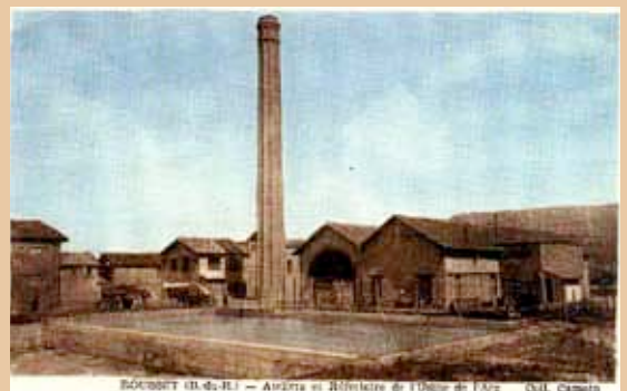
L'industrie en pays de Rousset, une activité pour le moins ancienne !

Toutes ces évolutions n'auraient pas été possibles sans une véritable culture industrielle de la population avoisinante : l'industrie est acceptée car les enjeux en termes d'emploi et de ressources sont compris par tous, politiques comme simples citoyens. Chacun sait que la vie dans la vallée ne serait pas aussi agréable sans les entreprises de la zone industrielle.