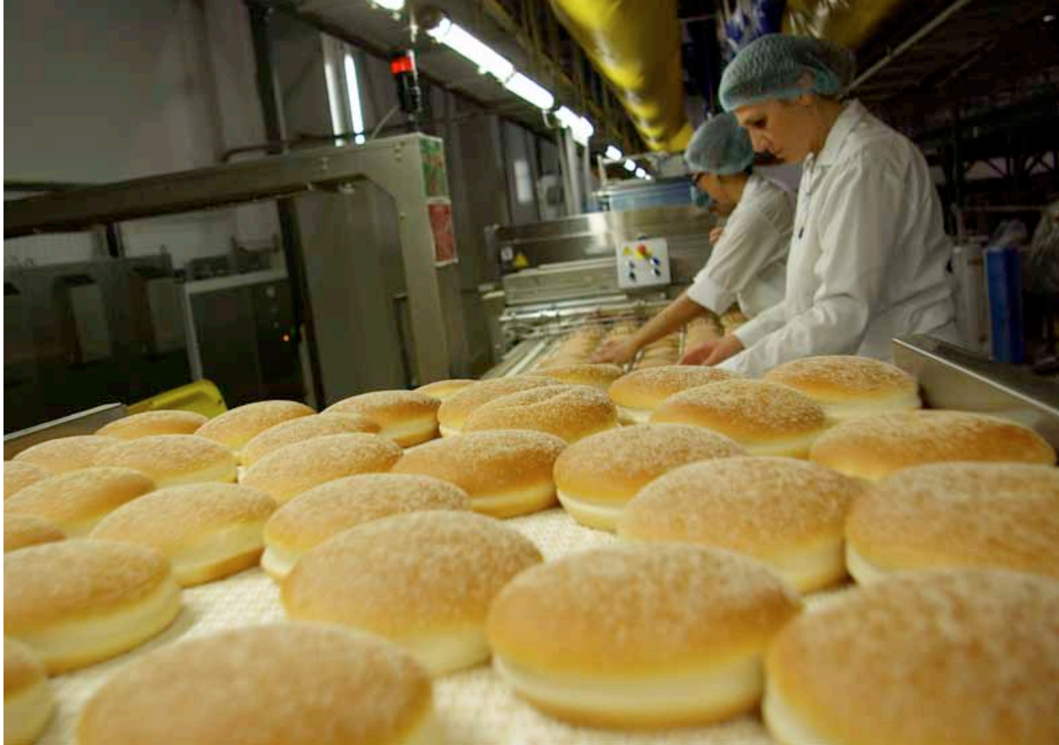
Les petits pains à hamburgers : le fonds de commerce d'East Balt. La filiale française de cette entreprise, créée il y a plus de 50 ans aux Etats-Unis, a ouvert au printemps 2010 une ligne de production à Aix-en-Provence