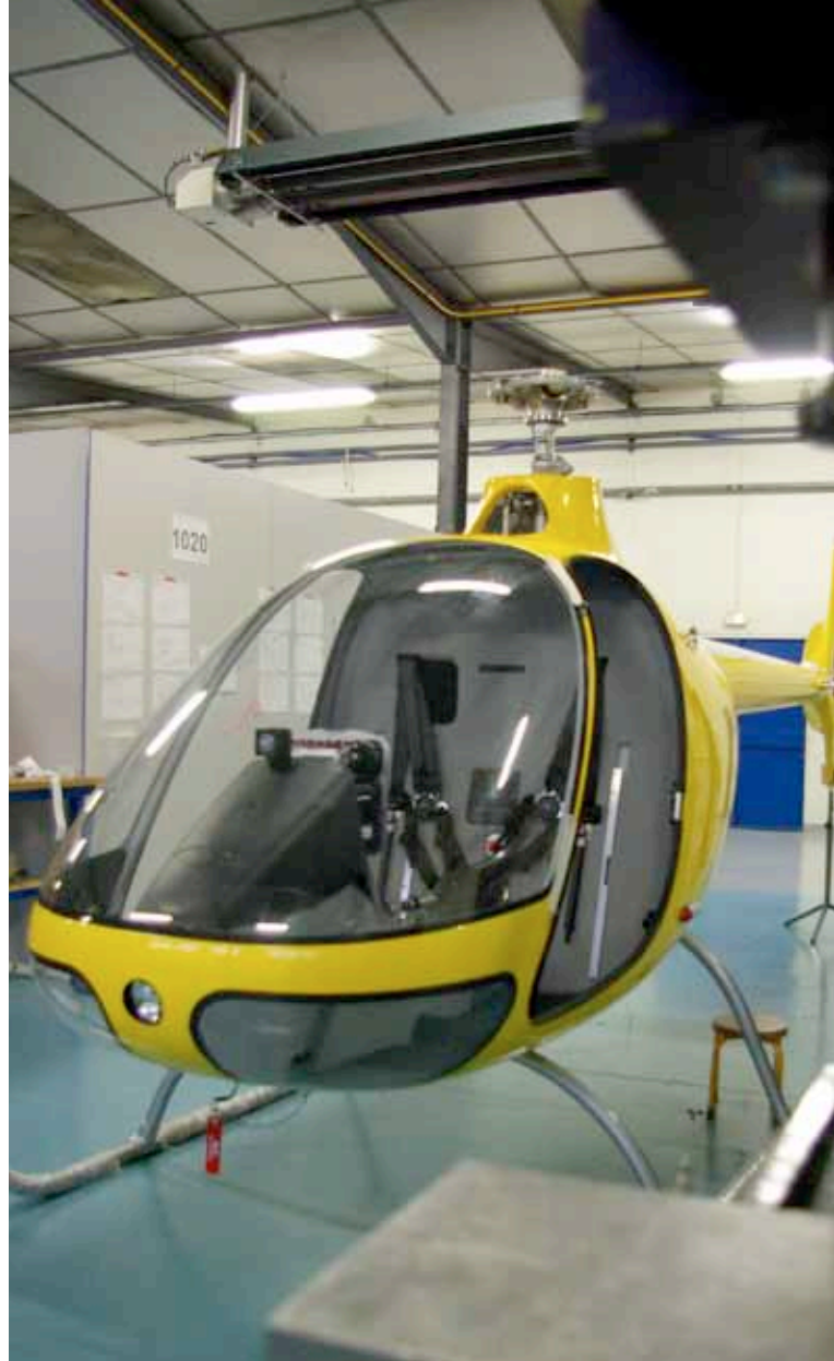
Le Cabri, le petit appareil 1 à 2 places d'hélicoptères Guimbal, conçu en Pays d'Aix. L'entreprise a livré 12 appareils en 2010, pour l'essentiel à l'étranger. Elle souhaite doubler sa production

Reste à définir les activités à prioriser pour inscrire ce secteur dans la durée. Aux côtés des filières historiques, les pôles de compétitivité, nombreux à être représentés en Pays d'Aix, peuvent donner le cap.